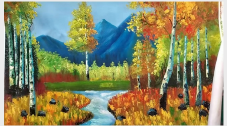
《林间》(绘画) 齿轮二工厂 李娅娟