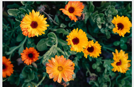
《盛开》(摄影) 企业管理中心 吴新峰