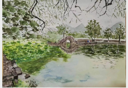
《桥景》(绘画) 齿轮二工厂 程晓琪