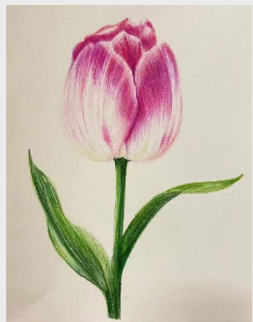
《含苞》(绘画) 齿轮二工厂 李姝娟