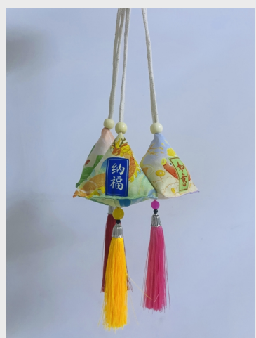
《端午香》(手工) 机械制造公司 伊丽艳