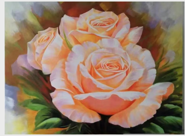
《盛放》(绘画) 机械制造公司 伊益合